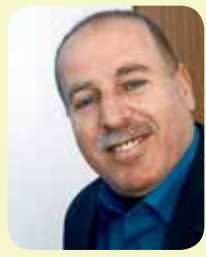
رئیس هیئت مدیره شرکت ملی گاز ایران

هیئت مدیره شرکت ملی گاز ایران در جلسه‌ای با حضور 46 تن از اعضای هیئت مدیره برگزار شد. در این جلسه، اعضای هیئت مدیره با مدیرعامل شرکت ملی گاز ایران گفت‌وگو کردند و در مورد برنامه‌های توسعه‌ای شرکت در سال آینده گفت‌وگو کردند. همچنین، اعضای هیئت مدیره با مدیرعامل شرکت ملی گاز ایران گفت‌وگو کردند و در مورد برنامه‌های توسعه‌ای شرکت در سال آینده گفت‌وگو کردند.