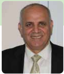
خه لیل عه بدوللا

سه نگه ری لی بگریته. چونکه ئه زمونه کان ئه و راستیه یان ده رخست که هه رچه ند چند گروهیککی تیرۆریستی له نمونه ی تالیان و ئه قاعیده و چه ندانی تر له رووی سه ربازی تیکشتران و به ته واوی لاواز کران. به لام هیزی تیرۆریستی تری له نمونه ی داعش له هه ناوی ئه و کۆمه لگه دواکه وتوه کانه وه به تین و ته وژمیککی گه وره وه سه ربان هه لدایه وه. ئه مهش ئه و راستیه ده رده خات که هه ریه که له و هیزه تیرۆریستیه